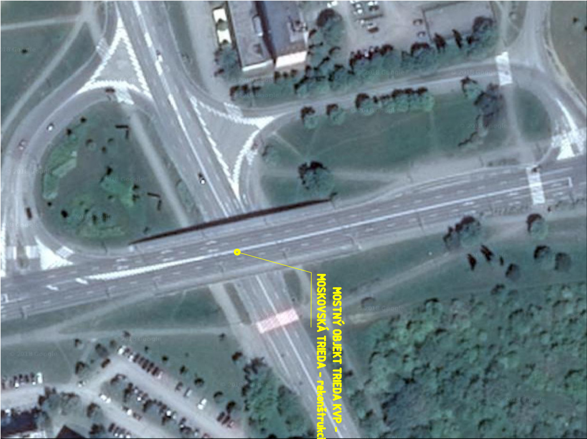
MOSTNÝ OBJEKT TRIEDA KVP - MOSKOVSKÁ TRIEDA – rekonštrukcia